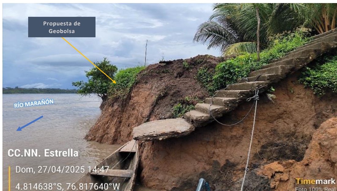
FIGURA N°02: RIBERAS Y ESCALERA PEATONAL EXPUESTAS A LA EROSIÓN FLUVIAL