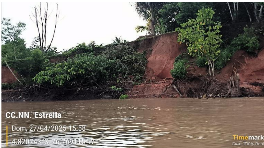
FIGURA N°03: ÁREAS DE CULTIVO EXPUESTAS A LA EROSIÓN FLUVIAL

Ministerio de Desarrollo Agrario y Riego