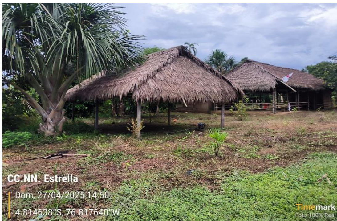
FIGURA N°01: VIVIENDAS AFECTADAS POR LAS INUNDACIONES